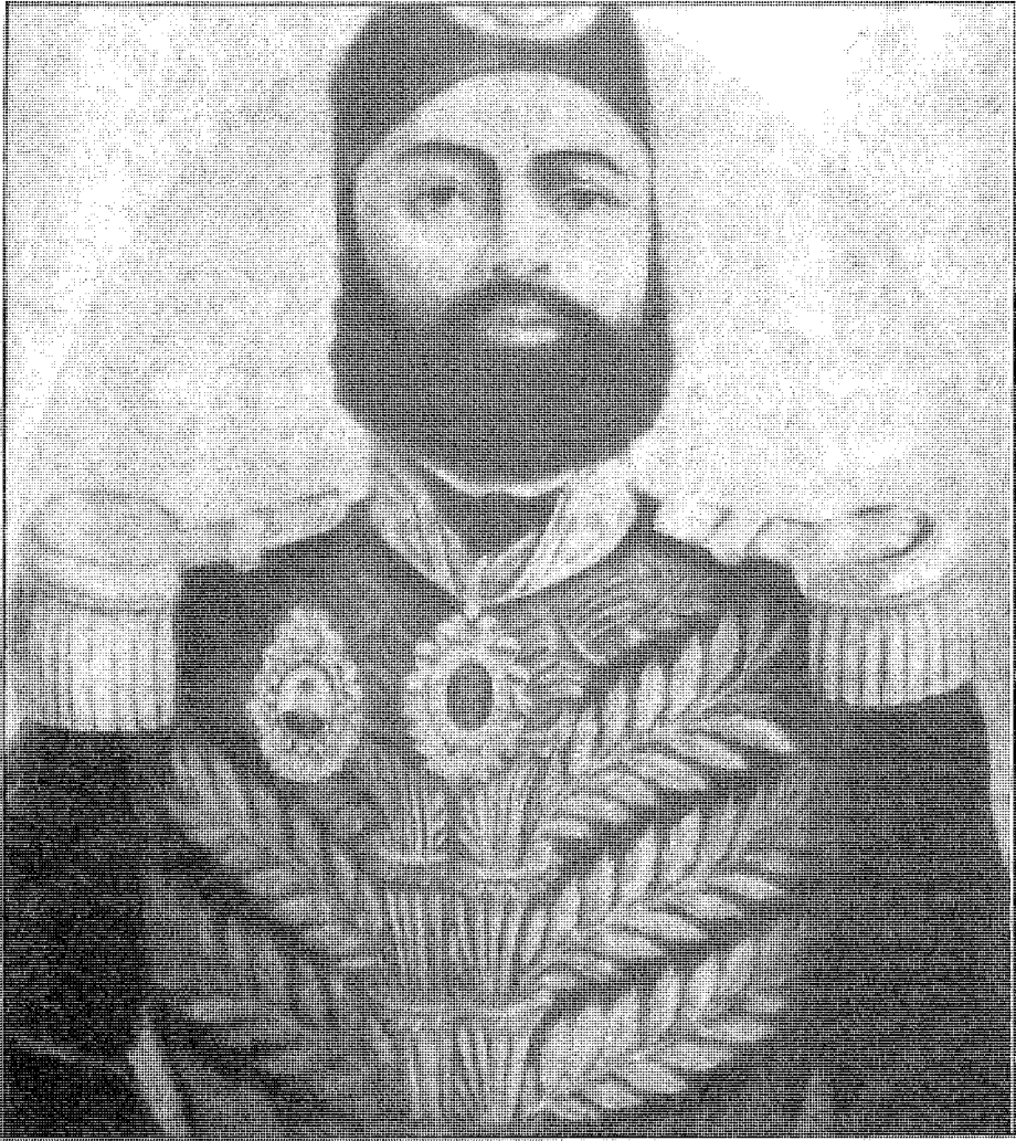
عباس باشا الأول مات مقتولا في قصره بينها بعد 6 سنوات من الحكم